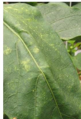
3 Schadbild Capsicum