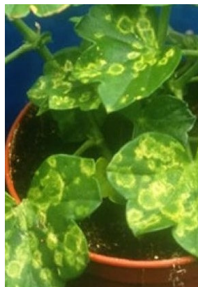
2 Schadbild Pelargonium